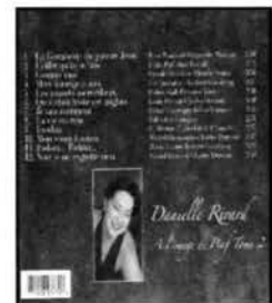
À l'image de Piaf Tome 2