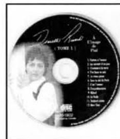
À l'image de Piaf Tome 1