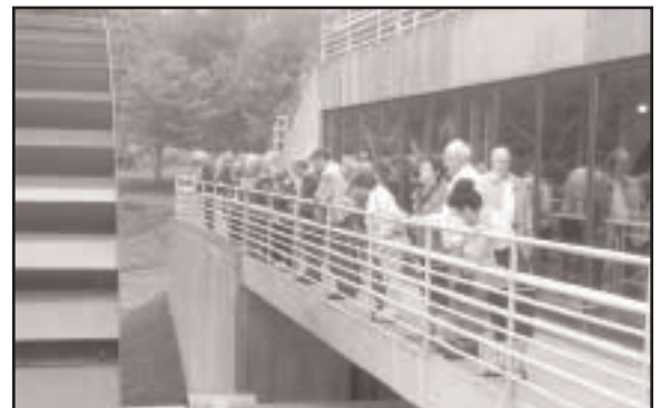
Aux Forges du St-Maurice les membres observent le fonctionnement de la grande roue à eau qui actionne les soufflets du haut fourneau.