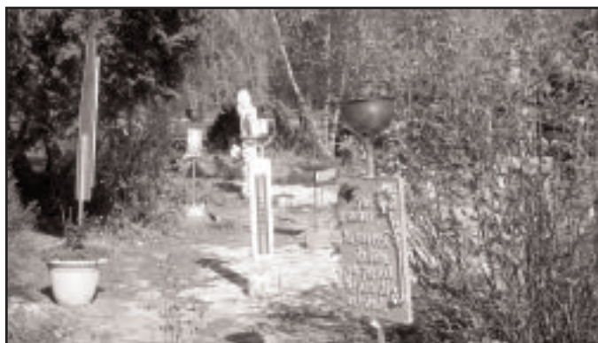
Vue du jardin où sont exposées de nombreuses sculptures.