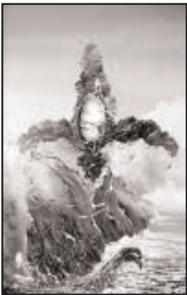
La fleur de lys atomique