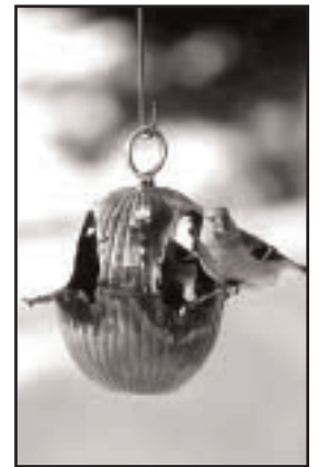
Mangeoire d'oiseaux Cuivre