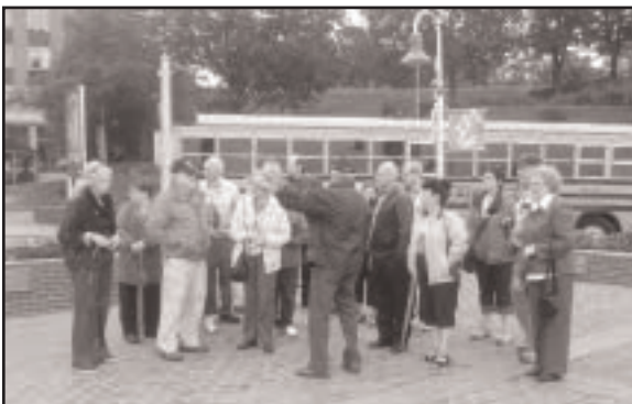
Rassemblement des participants à l'hôtel Delta juste avant le départ en autobus de visites guidées d'une journée.

Heureux sauvetage qui nous permettra de connaître par de savoureux détails, le récit des aventures et des périples de ce gouverneur. Les parcours sur la rivière St-Maurice et sur le fleuve, accompagnés d'un bon souper servi à nos tables clôturent la journée, marquée par la présence d'un radieux soleil.